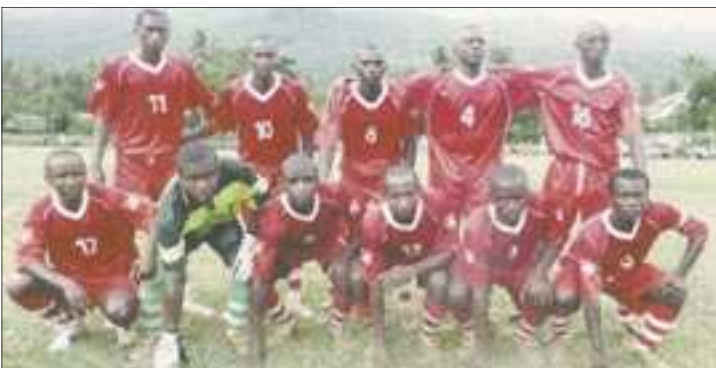
Ngaya club, un match de championnat avant la chute

Notons que les vétérans de Mdé joueront contre ceux de la Fédération comorienne de foot dans le cadre de l'inauguration de ce stade qui aura coûté, en tout, 28 millions de francs.