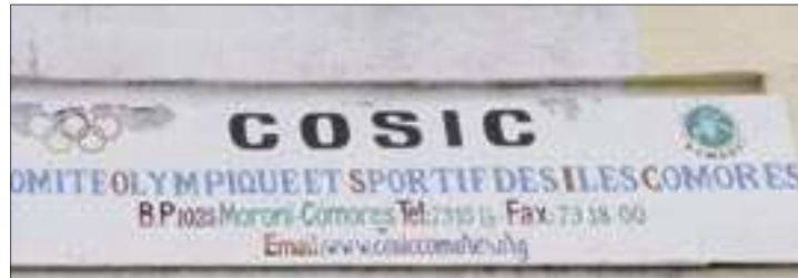
اللجنة الأولمبية ورياضة جزر القمر

وأذربيجان و طاجكستان، في حين تشكلت الثانية من السعودية وقطر والسنغال وأفغانستان وتركمانستان وستقام مبارياتها في مدينة أصفهان. أما مسابقة كرة الماء فستسجل مشاركة 7 منتخبات تم توزيعها على مجموعتين ضمت الأولى إيران و سوريا وأذربيجان والثانية الكويت وسوريا وقطر وتركمانستان.