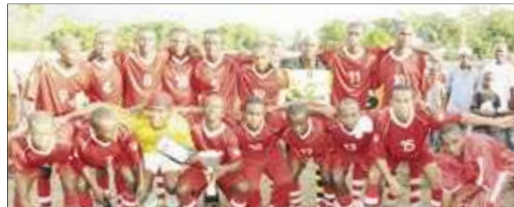
فريق نغايا قبل أن يهبط إلى الدرجة الثانية