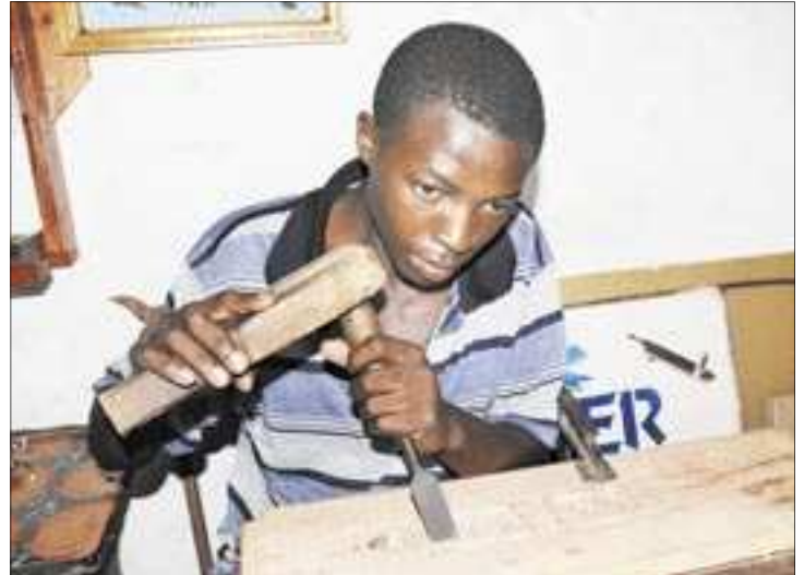
Parmi les projets, créer un lieu de rencontre avec les artisans

nos produits aux étrangers de passage et à la diaspora en vacances pour les inciter à acheter des objets cadeaux