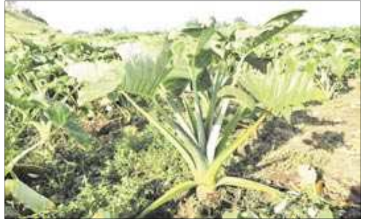
Les vols accentuent l'insuffisance des produits locaux.

« Les voleurs démoralisent les paysans. Pourtant, plus ces derniers délaissent les champs, plus le nombre de voleurs augmente » s'étonne