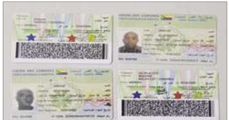
البطاقة الإلكترونية السائرة في البلاد

قال الأمين العام بوزارة التعليم العالي والبحث أحمد موسى في تصريح خاص لـ "بلد" إن إجبار الطلبة على