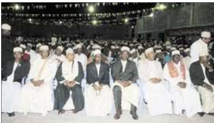
Une vue de l'assistance