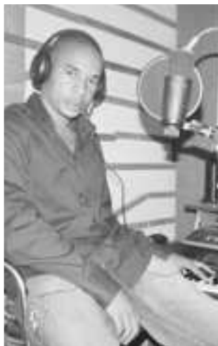
Djoban sort un nouveau clip intitulé Madjitso