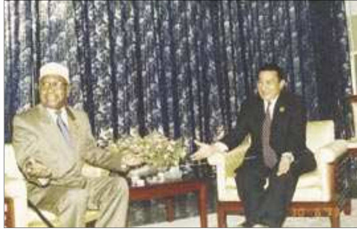
الرئيس محمد حسني مبارك مستقبلاً الرئيس محمد جوهر

أقره الشعب باستفتاء جرى في 7 مايو/حزيران 1992.