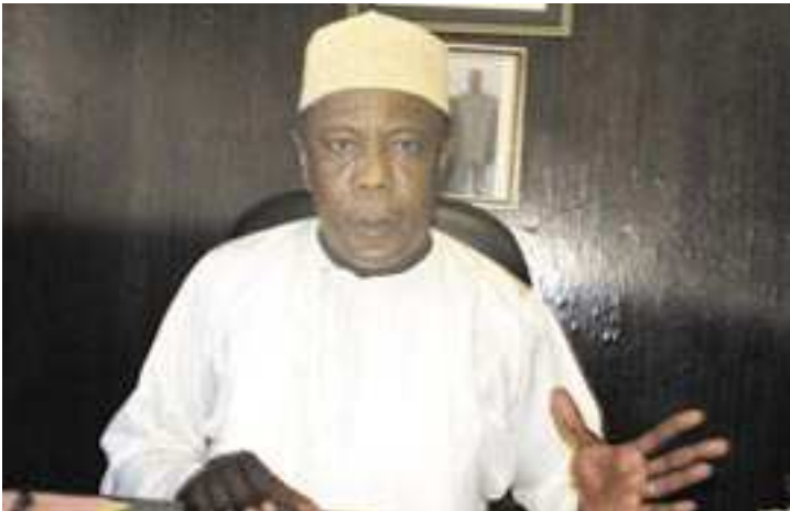
Said Mhamadi, directeur général du budget

A près la polémique enclenchée par les élus de l'île autonome Ngazidja sur le budget 2010, la direction du budget a souhaité apporter des éclaircissements sur l'ensemble des éléments qui composent ce budget adopté récemment par l'Assemblée nationale.