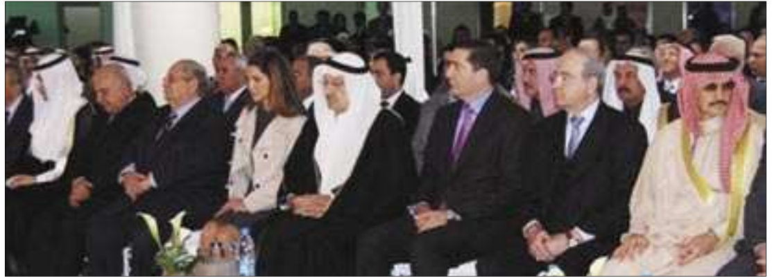
الأمير طلال والملكة رانيا يتابعان حفل تدشين مقر الجامعة

هذا وتجول سموه برفاقه صاحب السمو الملكي الأمير تركي بن طلال وصاحب السمو الملكي الأمير عبدالرحمن بن طلال في أقسام البنك واستمع إلى شرح عن مجريات العمل في البنك وإنجازاته.