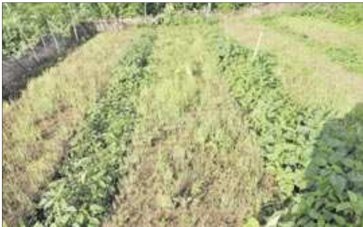
Les produits maraîchers sont la cible des voleurs.

Ces méfaits, avaient un moment semblé préoccuper