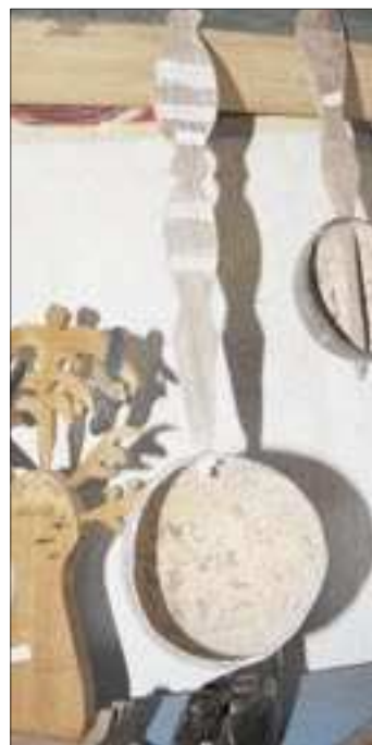
Cinq projets pour développer le secteur artisanat comorien

Construire une maison de l'artisanat, qui jouera le rôle d'un centre national de l'artisanat