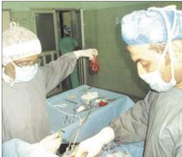
Presque les établissements sanitaires travaillent dans des conditions très précaires

« Actuellement, nous envoyons les matériels à la Pnac qui a les moyens de les stériliser. C'est grâce à eux que nous savons repris les opérations chirurgicales », a indiqué la même source. Autant de contraintes qui fragilisent le fonctionnement du bloc opératoire, comme l'insuffisance des dotations en matériels de protection, notamment les consommables (gants), compresses et sparadraps pour ne citer que cela, ou encore la vétusté du bâtiment.