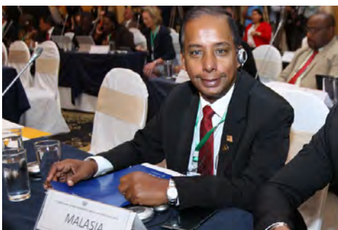
PGA Member M Kulasegaran, MP (Malaysia)