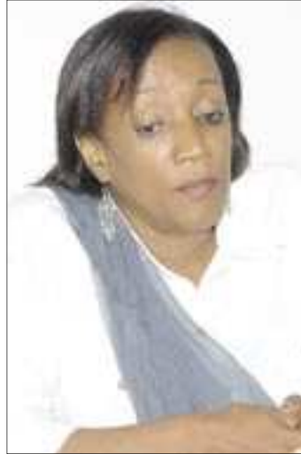
مفوضة التخطيط السيدة صفية تاج الدين

أكدت المفوضة العامة للتخطيط السيدة صفية تاج الدين خلال مؤتمر صحفي عقدته مساء الخميس 25 فبراير بمقر المفوضية بالعاصمة موروني أن الحكومة القطرية تتولى نفقات الوفد القمري المشارك في مؤتمر الدوحة في 9-10 مارس الجاري و المكون من 70 شخصا. ولفتت السيدة صفية تاجي الدين إلى أن رئيس البنك الدولي رحب بالدعوة الموجهة إليه للمشاركة في المؤتمر، مشيرة إلى أن وتيرة التحضيرات للمؤتمر تسير وفقا للخطة المرسومة موضحة أن الوفد القمري، الذي قام مؤخرا بزيارة دولة قطر لوضع اللمسات، تأكد من جديد أن قطر وفرت