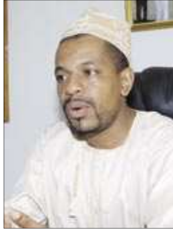
المفوض مفاهايا محمد مدير الإدارة الوطنية للتوثيق وحماية الدولة

الحالية تكمن فيما ستشهده البلاد في الأيام المقبلة من زيارة عدد من رؤساء ومسؤولين كبار من الدول الإفريقية