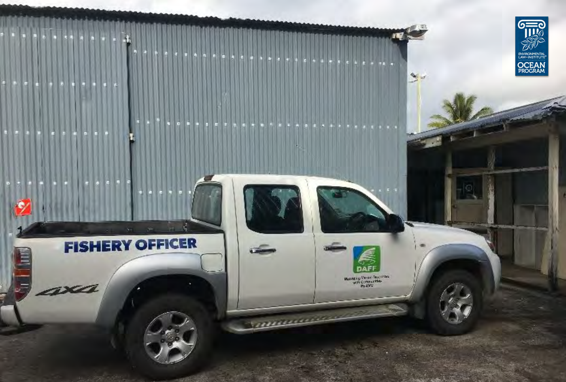
Foto: Proyecto ELI de pesca y gestion de AMPs en Niue