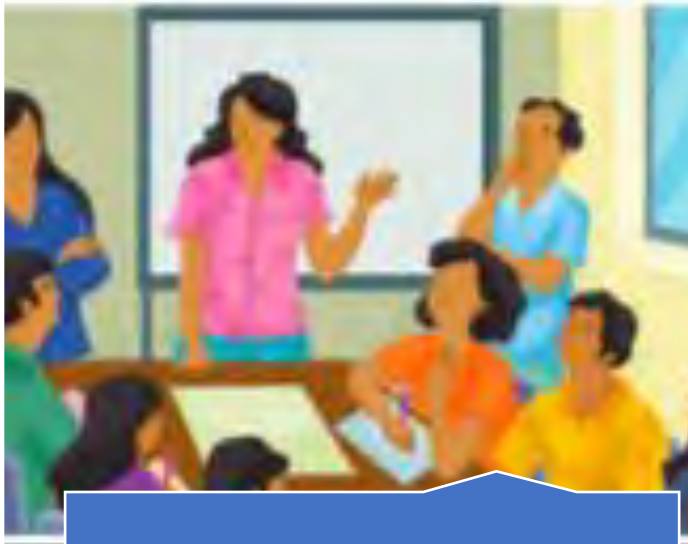
Mesa de diálogo